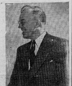
Doctor Milton Eisenhower

La posible conquista de una nación latinoamericana en nuestros días, no se llevaría a cabo, según cualquiera puede prever, por el ataque directo. Se llevaría a cabo, más bien, por medio del procedimiento insidioso de la infiltración, la conspiración, la mentira y la socavación de las instituciones libres, una por una. Hay grupos de co- —Pasa a la Pág. CUATRO